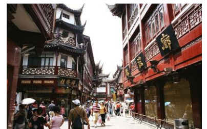
上海の下町・豫園商場