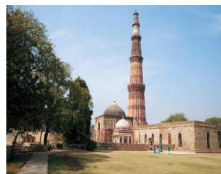
クトゥブ・ミナール